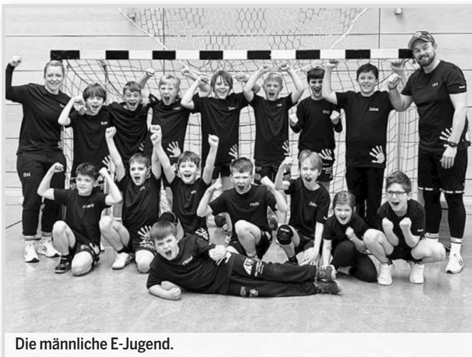
Die männliche E-Jugend.