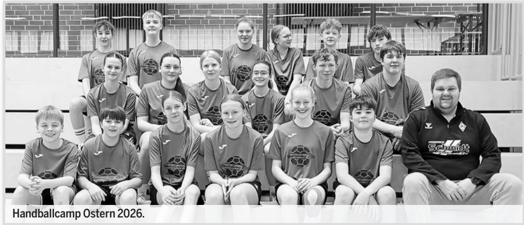
Handballcamp Ostern 2026.

Die männliche C-Jugend hat mit 14 Spielen ein wirklich strammes Programm zu absolvieren. Von vornherein war allen klar, dass die Saison an die Substanz der Spieler gehen wird, weil lediglich ein knapper Kader zur Verfügung stand. Ein Aushelfen der D-Jugendlichen war somit unvermeidbar. Trotz dieser Widrigkeiten konnten bis auf ein Spiel alle angesetzten Begegnungen ausgetragen werden. Deutlich unterlegen waren die Seesener nur gegen die Spitzenteams, ansonsten haben sie stets gut mitgehalten und die Spiele lange offenhalten können. Die Entscheidungen fielen zumeist in der Schlussphase, als sich die dünne Decke und die körperliche Unterlegenheit bemerkbar machten. Im letzten Spiel gelang dann aber noch der erste Sieg; noch dazu auswärts und zudem sehr deutlich. Damit war der Beweis erbracht, dass unsere Jungs auch Handball spielen können.