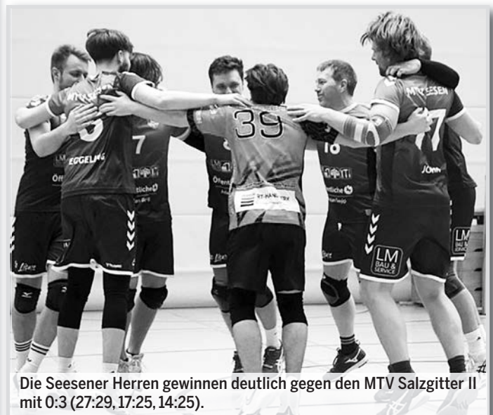
Die Seesener Herren gewinnen deutlich gegen den MTV Salzgitter II mit 0:3 (27:29, 17:25, 14:25).