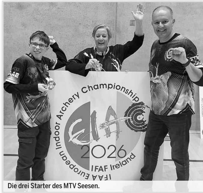
Die drei Starter des MTV Seesen.

Knapp 500 Schützen aus 21 Nationen nahmen am Wettkampf teil, an drei Schießtagen mussten die Sportler ihr Können zeigen. Dabei wurden zwei sogenannte Standard Rounds auf 20 Yards (etwas über 18 Meter) geschossen und eine Flint Runde, bei der man jede Passe (Satz von fünf Pfeilen) auf wechselnde,