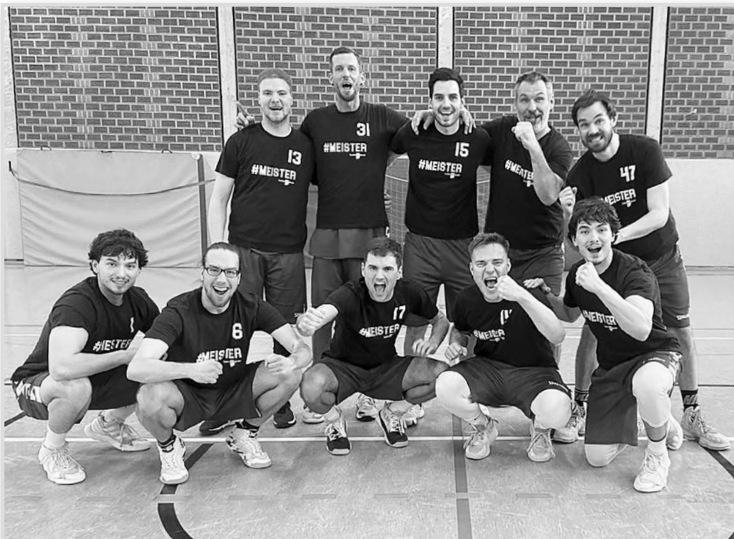
Einer der erfolgreichsten Momente der letzten Jahre: Die Meisterschaft in der Regionsklasse. Künftig werden diese Momente ausbleiben – der Spielbetrieb wird eingestellt.