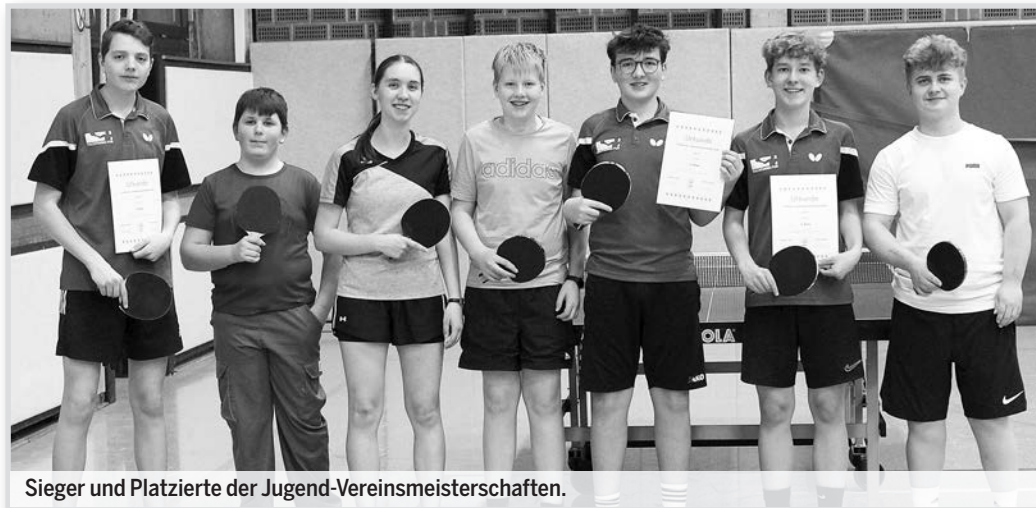
Sieger und Platzierte der Jugend-Vereinsmeisterschaften.