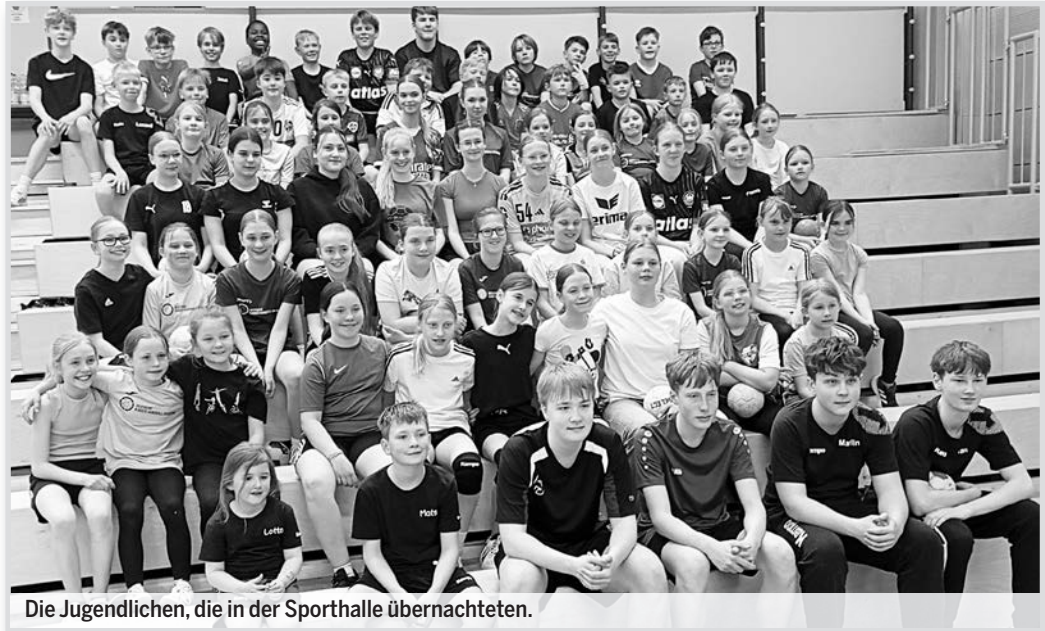
Die Jugendlichen, die in der Sporthalle übernachteten.

Das Highlight des Jahres fand am Ende der Saison statt. Schon lange hatten die Verantwortlichen den Plan im Kopf, mit den Kindern und Jugendlichen der MTV-Handballabteilung in der Sporthalle zu übernachten. Eine Vielzahl von Gesprächen war im Vorfeld schon nötig, um diese Absicht Ende April endlich zu verwirklichen. Der Landkreis Goslar hatte dem Antrag auf eine Nutzungsänderung dankenswerterweise zugestimmt. Mit der organisatorischen Planung wurde bereits viele Wochen vorher begonnen; es sollte schließlich alles klappen, und wir wollten unserer Jugend ein Event bieten, das lange in Erinnerung bleibt. Die Begeisterung war bei allen riesig, aber auch die Verantwortlichen waren rundum zufrieden. Immerhin hatte eine solche sportliche Veranstaltung Premiere; es konnte sich wirklich niemand daran erinnern, dass ein solches Event schon jemals stattgefunden hat. Die Beteiligung aus allen Jugendmannschaften war enorm; es waren über achtzig Kids dabei. Selbst die Mini Handballer, die in der kommenden Saison in der E-Jugend unterwegs sein werden, waren mit viel Spaß und Freude dabei. Es wurde bis spät in den Abend hinein Handball gespielt; ein jeder hatte die Möglichkeit, sich beim Handballspielen so richtig auszutoben. In gemischten Mannschaften – Groß und Klein bzw. Jungs und Mädchen untereinander aufgeteilt – ging es hoch her. Bei Niemandem war so etwas wie Müdigkeit erkennbar. Dank