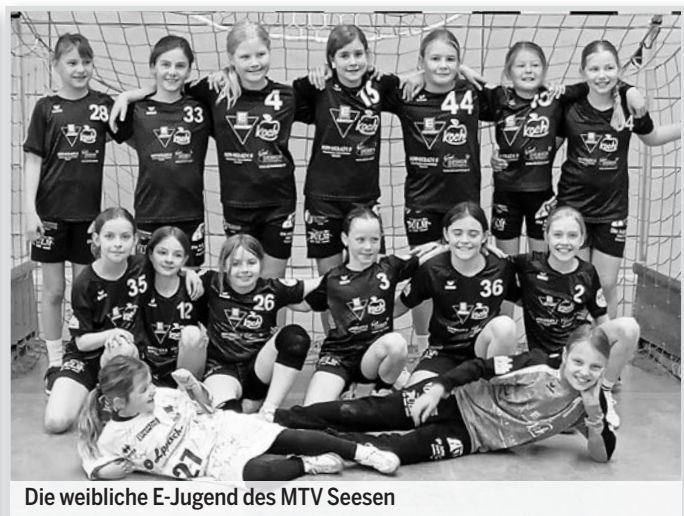
Die weibliche E-Jugend des MTV Seesen