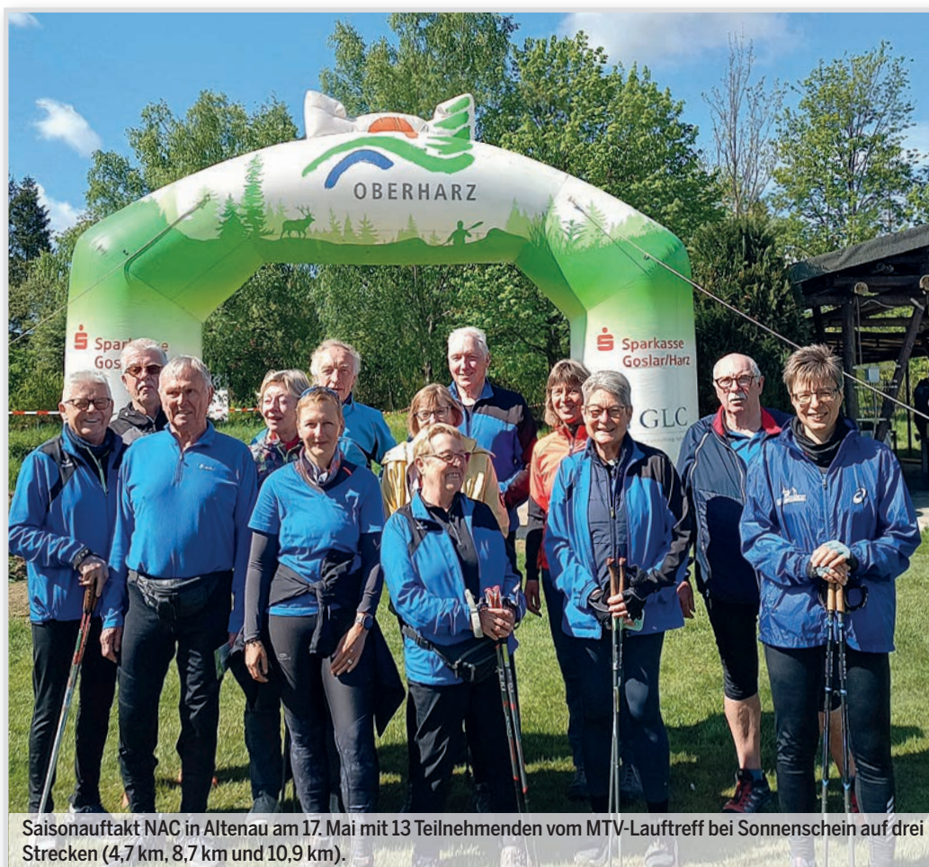
Saisonaufakt NAC in Altenau am 17. Mai mit 13 Teilnehmenden vom MTV-Lauftreff bei Sonnenschein auf drei Strecken (4,7 km, 8,7 km und 10,9 km).