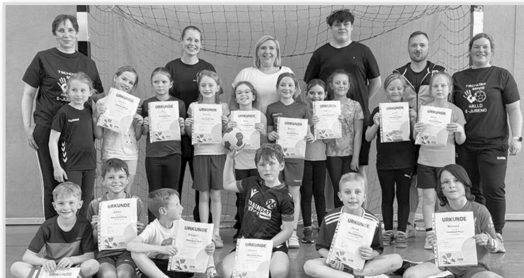
Die Verabschiedung der Mini Handballer; jetzt geht es bei der E-Jugend weiter.