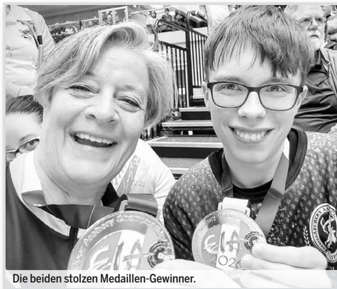
Die beiden stolzen Medaillen-Gewinner.