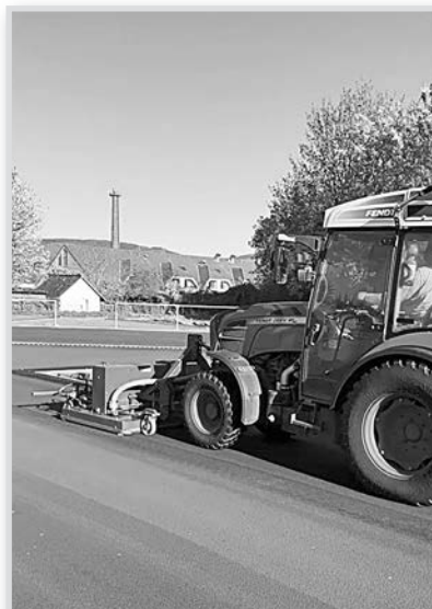
Reinigung der Tartanbahn.

Crunches oder Beugestütz) wurde nochmal ein Blick geworfen.